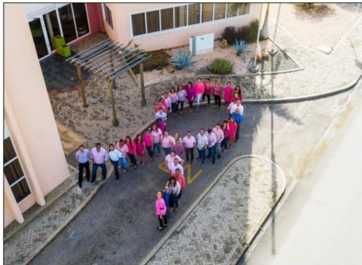
Por medio di su sinta Humano, Aruba Tourism Authority (ATA) su ekipo ta aporta na conscientisacion di Cancer di Pecho.